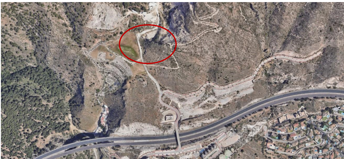
Espacio para práctica deportiva de tiro con arco sobre Ortofoto

El ámbito de actuación se situaría en suelo rústico, promoviendo así la protección y el disfrute de espacios naturales por parte de la población. Además, la solicitud de concesión administrativa de un terreno en la antigua cantera de Benalmádena para la práctica del tiro con arco permitiría un uso sostenible del suelo rústico, alineándose con la diversificación económica sostenible basada en la economía verde y circular, y fomentando actividades deportivas y culturales en un entorno natural adecuado.